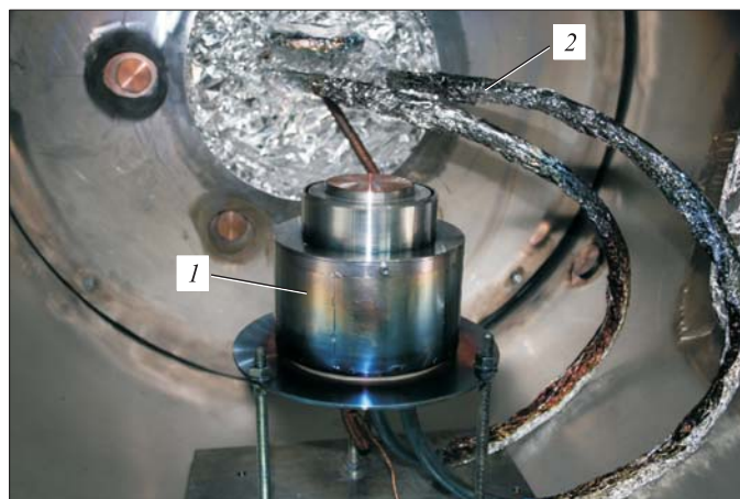
Рис. 1. Расположение МРС (1) с жидкометаллическим катодом (2) в вакуумной камере

Взвешивание катода вместе с тиглем до и после работы для оценки коэффициента катодного распыления проводили на аналитических весах Sartorius CPA225D с точностью 0,01 мг.